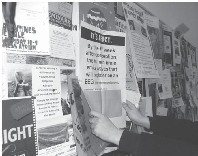
Woman rips down inaccurate anti-choice poster at University of Alberta.