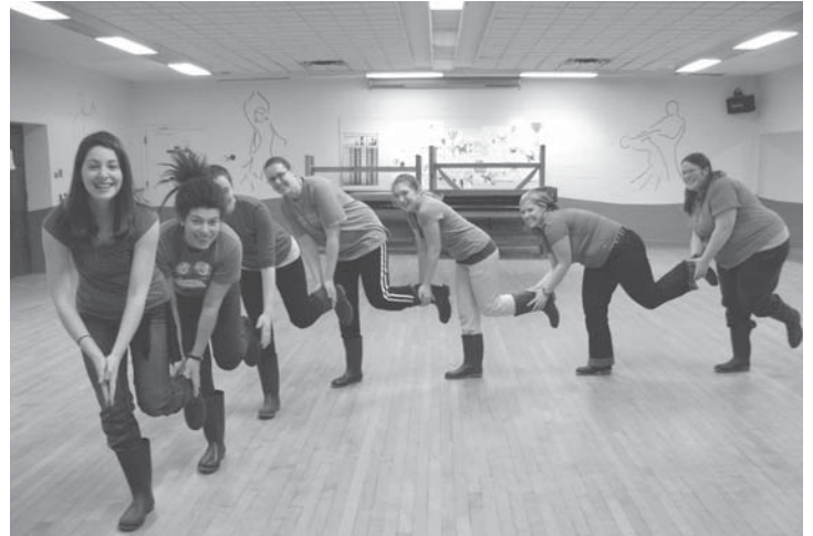
Les Rebelles du N.-B. se lancent dans le «gumboot» pour promouvoir la paix, les choix reproductifs et la justice sociale pour toutes et tous.

Mais de tels faits n'ont jamais empêché le mouvement anti-choix de répandre sa désinformation. Un groupe qui se nomme Signal Hill vient de publier les résultats de son propre sondage Angus-Reid, selon lequel 92% des répondant-es ne savaient pas que