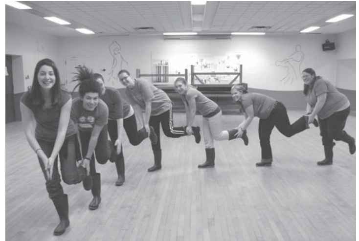
The N.B. Rebelles, take up gumbooting to promote peace, reproductive choice and social justice for all.

Such facts have never stopped the anti-choice movement from spreading misinformation. An anti-choice group called Signal Hill just released the results of their